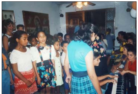
Comunidad inicial de Ntra. Sra. de Belén